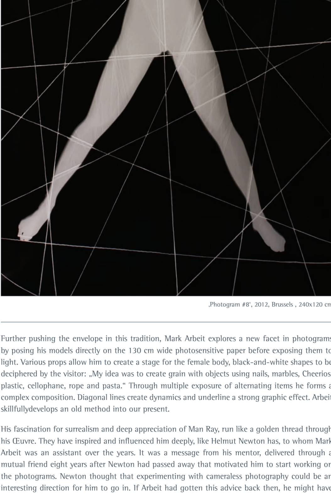
„Photogram #8“, 2012, Brussels, 240x120 cm

Photograms are a classic method of producing evocative imagery by exposing photosensitive material to light through objects solid or translucent. Christian Schads „Schadographies“ are commonly accepted as the origin of the modern photogram and mark the starting point of a trend which had reached the first peak in its popularity during the 1920s. Artists like Man Ray and László Moholy-Nagy experimented in this form of ‚photography without a camera‘, and Floris M. Neusüss went on to create silhouettes of female models during the sexual revolution of the 1960s and early 1970s, for which Fritz L. Gruber later coined the iconic term of ‚nudogram‘.