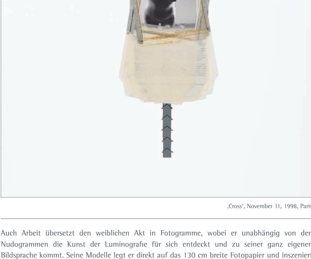
„Cross“, November 11, 1998, Paris