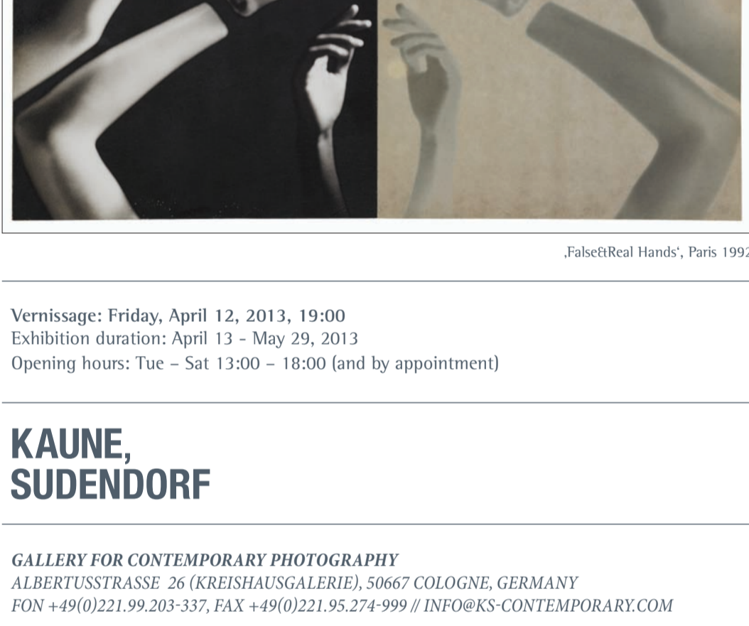
„False&Real Hands“, Paris 1992