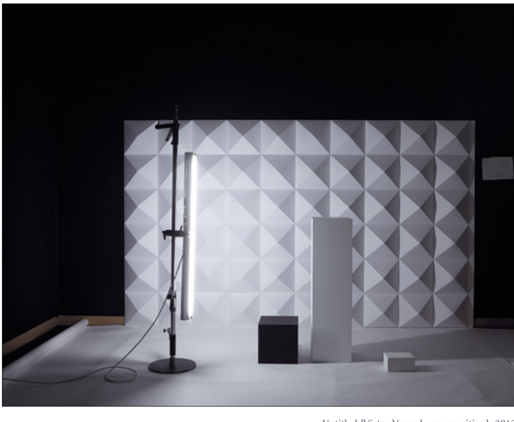
Untitled (Victor Vasarely, composition), 2013

MARINA GADONNEIX AT KAUNE, POSNIK, SPOHR GALLERY