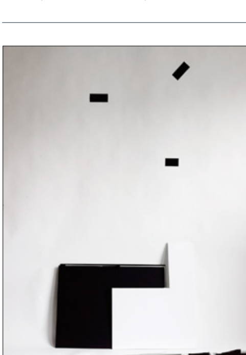
Untitled (Alexander Calder, hanging mobile), 2013