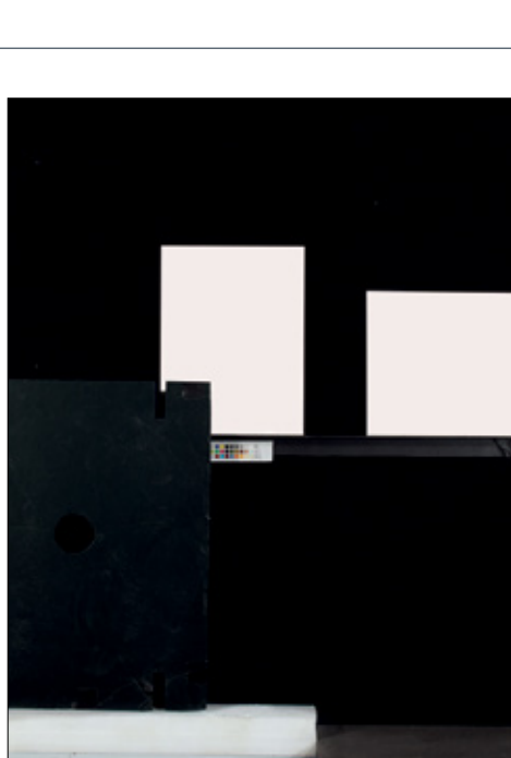
Untitled (Hiroshi Sugimoto, time exposed, portfolio), 2013