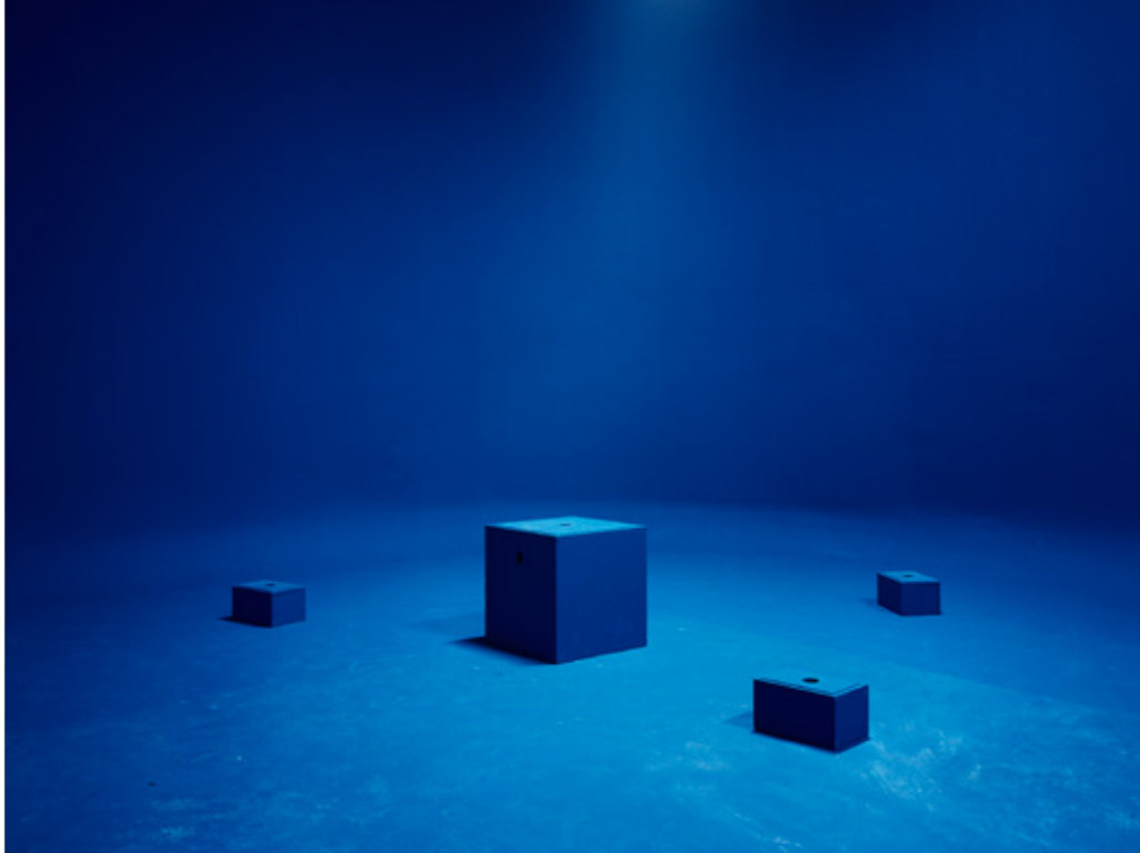
Rock and Sand, Paris 2011

Marina Gadonneix wurde 1977 in Paris geboren. Von 1996-2002 studierte sie an der École Nationale Supérieure de la Photographie in Arles. 2006 wurde sie mit dem Prix HSBC pour la Photographie ausgezeichnet. Sie lebt und arbeitet in Paris.